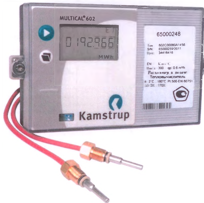
Рисунок 1 - Общий вид теплового счетчика MULTICAL® 602