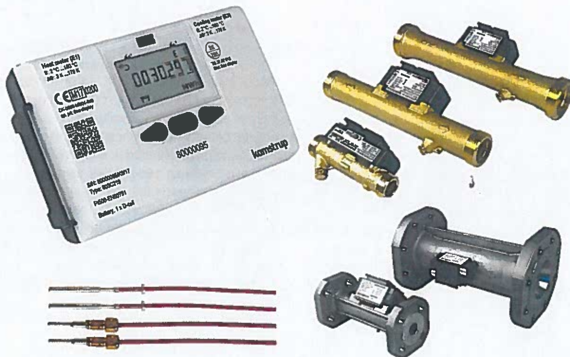
Рисунок 1 - Общий вид теплосчетчика MULTICAL® 603

Схема пломбировки от несанкционированного доступа, обозначение места нанесения знака поверки представлены на рисунке 2.