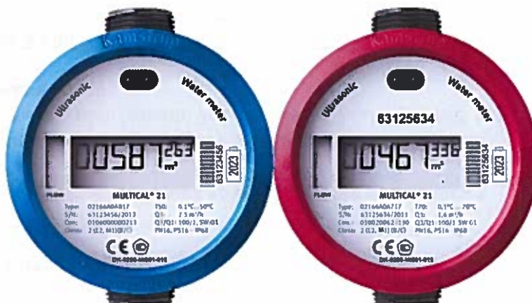
Рисунок 1. Фото общего вида

Общий вид счетчиков представлен на рисунке 1.